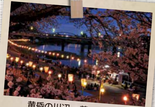
黄昏の川辺 芝 次昇氏